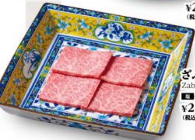
ざぶとん Zabuton ¥2,680 (税込¥2,948)