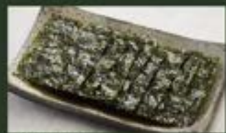
韓国海苔 ¥380 Korean Seaweed (税込¥418)