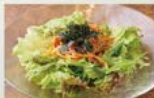
旨辛ねぎサラダ Spicy Green Onion Salad ¥680 (税込¥748)