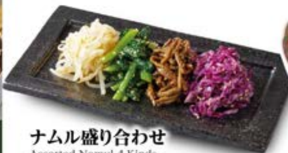
ナムル盛り合わせ Assorted Namul 4 Kinds 季節により異なります。 ¥690 (税込¥759)