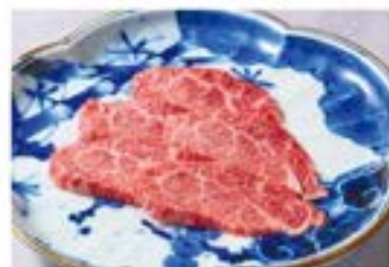
カルビ ¥1,580 Short Rib (税込¥1,738) ■ or □