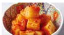
大根のキムチ Radish Kimchi ¥490 (税込¥539)