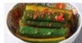
きゅうりのキムチ Cucumber Kimchi ¥490 (税込¥539)