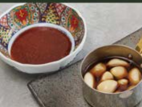
ニンニク焼き ¥480 Grill Garlic (税込¥528)