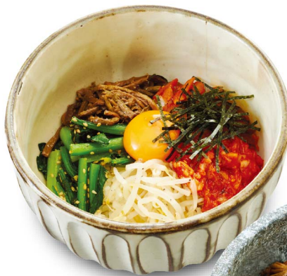
ビビンバ Bibimbap-Rice ¥1,100(税込¥1,210)