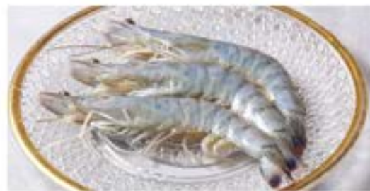
天使の海老塩焼き 3尾 ¥1,880 Salt-grilled angel shrimp (税込¥2,068)