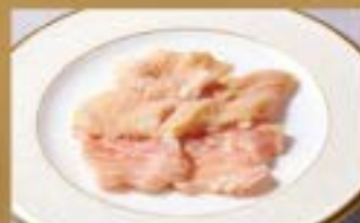
ホルモン Intestine ¥980 (税込¥1,078)