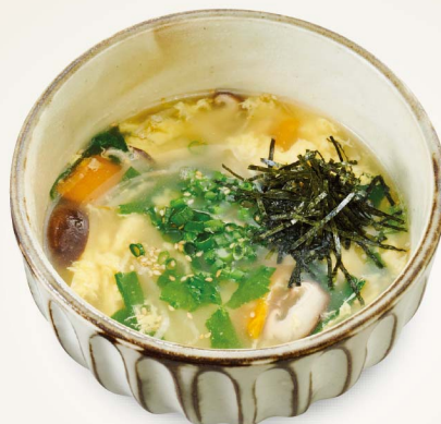
玉子野菜クッパ Egg and Vegetable Rice Soup ¥780(税込¥858)