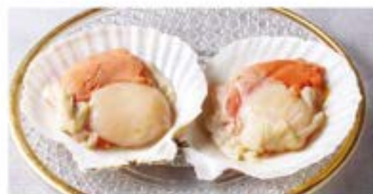
ホタテ焼き ¥1,280 Grilled Scallops (税込¥1,408)