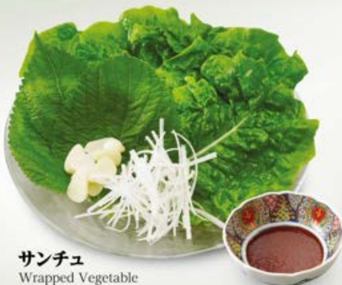
サンチュ Wrapped Vegetable ¥780 (税込¥858)