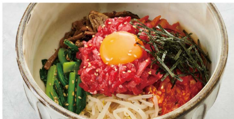
炙りユッケビビンバ Bibimbap-Rice with Broiled Wagyu Tartare ¥1,780(税込¥1,958)