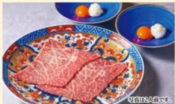
赤身ロースすき焼き (生卵一口ごはん付) Red Meat Loin Suki-yaki ¥1,780 (税込¥1,958)