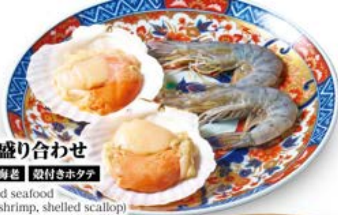
海鮮盛り合わせ 天使の海老 殻付きホタテ Assorted seafood (Angel shrimp, shelled scallop) ¥2,480 (税込¥2,728)