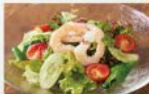
ぷりぷりエビのサラダ Juicy shrimp salad ¥780 (税込¥858)