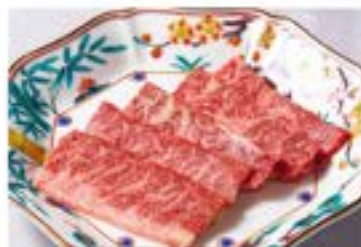
ハラミ ¥2,580 Skirt Steak (税込¥2,838) ■ or □