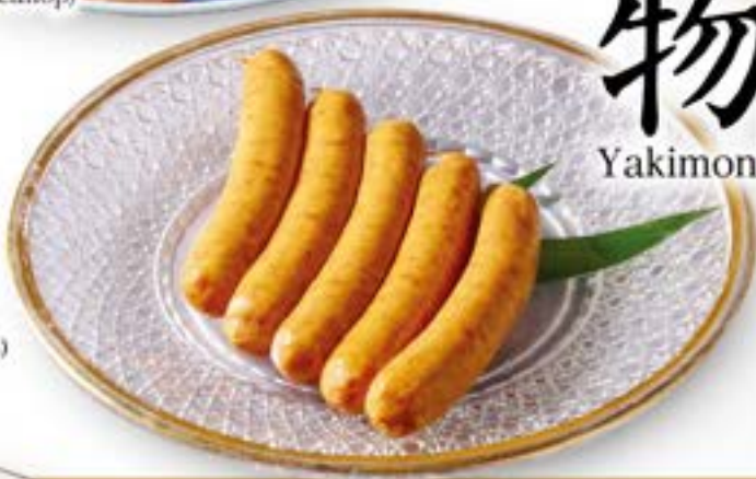
山形牛入り ソーセージ Yamagata beef sausage ¥780 (税込¥858)