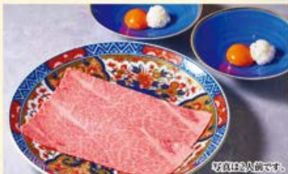
霜降りロースすき焼き (生卵一口ごはん付) Marbled Loin Suki-yaki ¥1,980 (税込¥2,178)