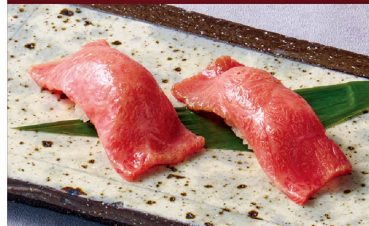
和牛の炙り肉寿司 Broiled Wagyu Beef Sushi