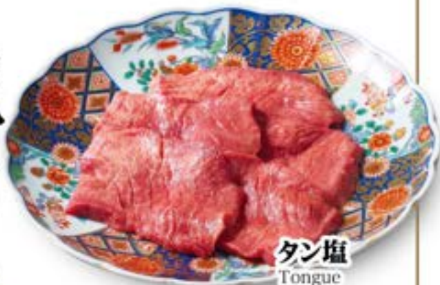
タン塩 Tongue ¥2,280 (税込¥2,508)