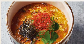
極ユッケジャンクッパ Yukgaejang Gukbap ¥1,180 (税込¥1,298)