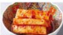
長芋のキムチ Yam Kimchi ¥490 (税込¥539)