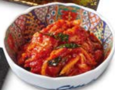
本気の白菜キムチ Serious Chinese Cabbage Kimchi ¥580 (税込¥638)