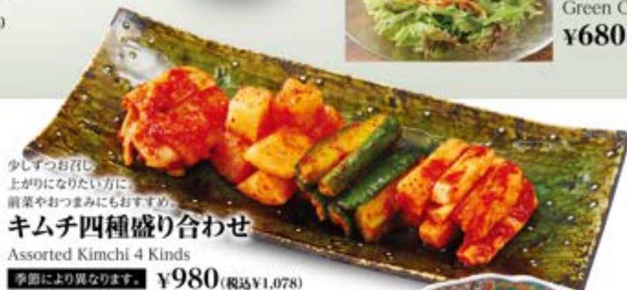
少しずつお召し上がりになりたい方に 前菜やおつまみにもおすすめ キムチ四種盛り合わせ Assorted Kimchi 4 Kinds 季節により異なります。 ¥980 (税込¥1,078)