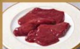
レバー Liver ¥980 (税込¥1,078)