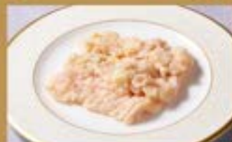
上ミノ Best of Tripe ¥1,280 (税込¥1,408)

お肉に触れた トング・箸・皿 がその他の料理に触れないようにしましょう。 レバーやホルモンは、 中心部まで加熱 してからお召し上がりください。