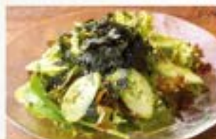
チョレギサラダ Choregi Salad (Green Salad with Salty Dressing) ¥780 (税込¥858)