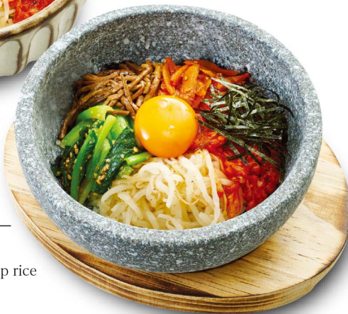
ミニ石焼きビビンバ Mini-Stone Roated Bibimbap rice ¥880(税込¥968)