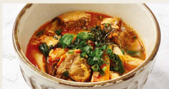
極カルビクッパ ¥1,180 Galbi Gukbap (税込¥1,298)