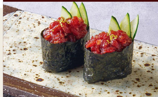
ユッケ軍艦 Yukhoe Gunkan