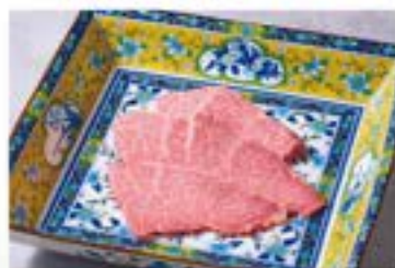
上カルビ ¥2,680 Best of Short Rib (税込¥2,948) ■ or □