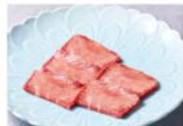
上タン塩 ¥3,580 Best of Tongue (税込¥3,938) ■ or □