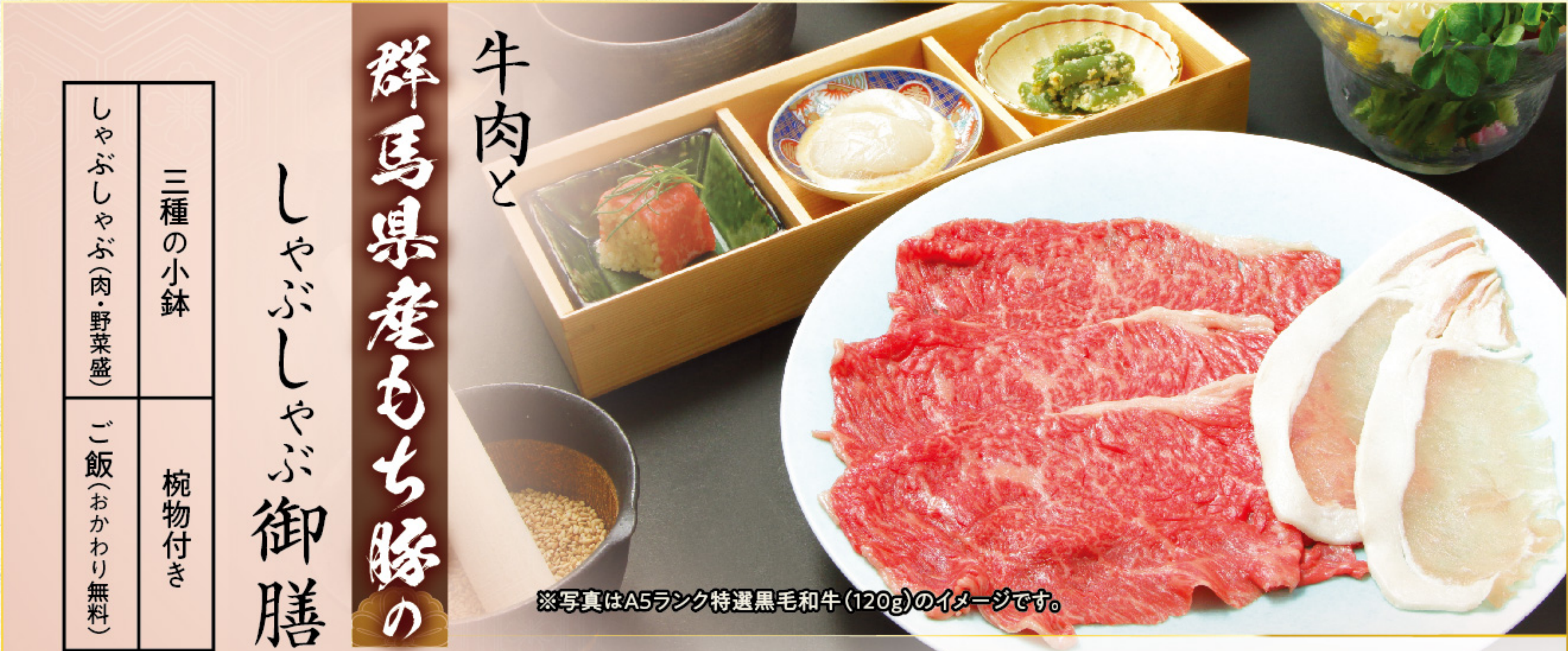
※写真はA5ランク特選黒毛和牛(120g)のイメージです。