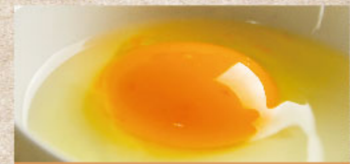
生卵 Raw Egg 生鸡蛋