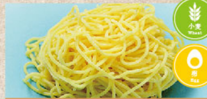
麺の中華麺 Chinese Noodle 中华面