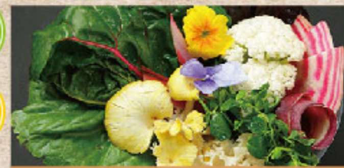
野菜の盛り合わせ Assorted Vegetables 各式蔬菜的微妙组合