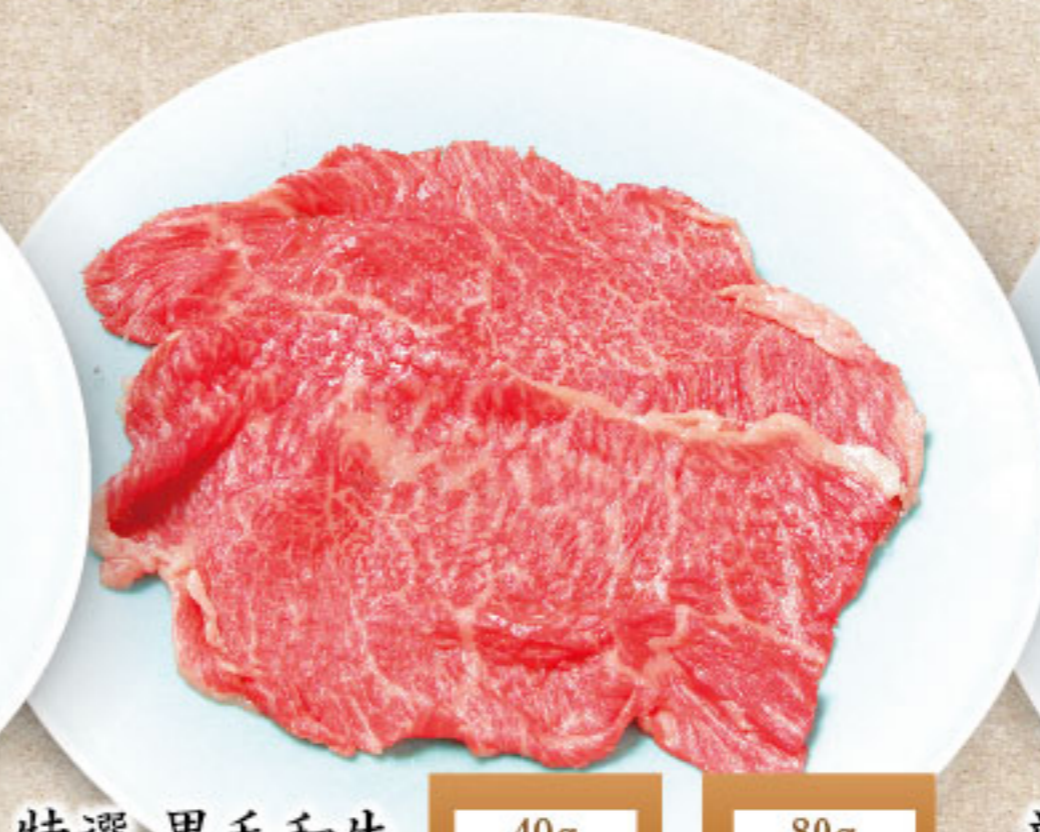
特選 黒毛和牛 Choicest Wagyu Beef A5 級黒毛牛