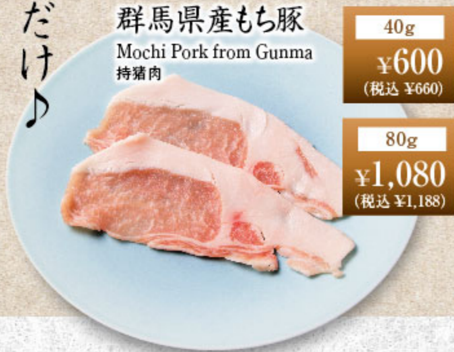
群馬県産もち豚 Mochi Pork from Gunma 持猪肉