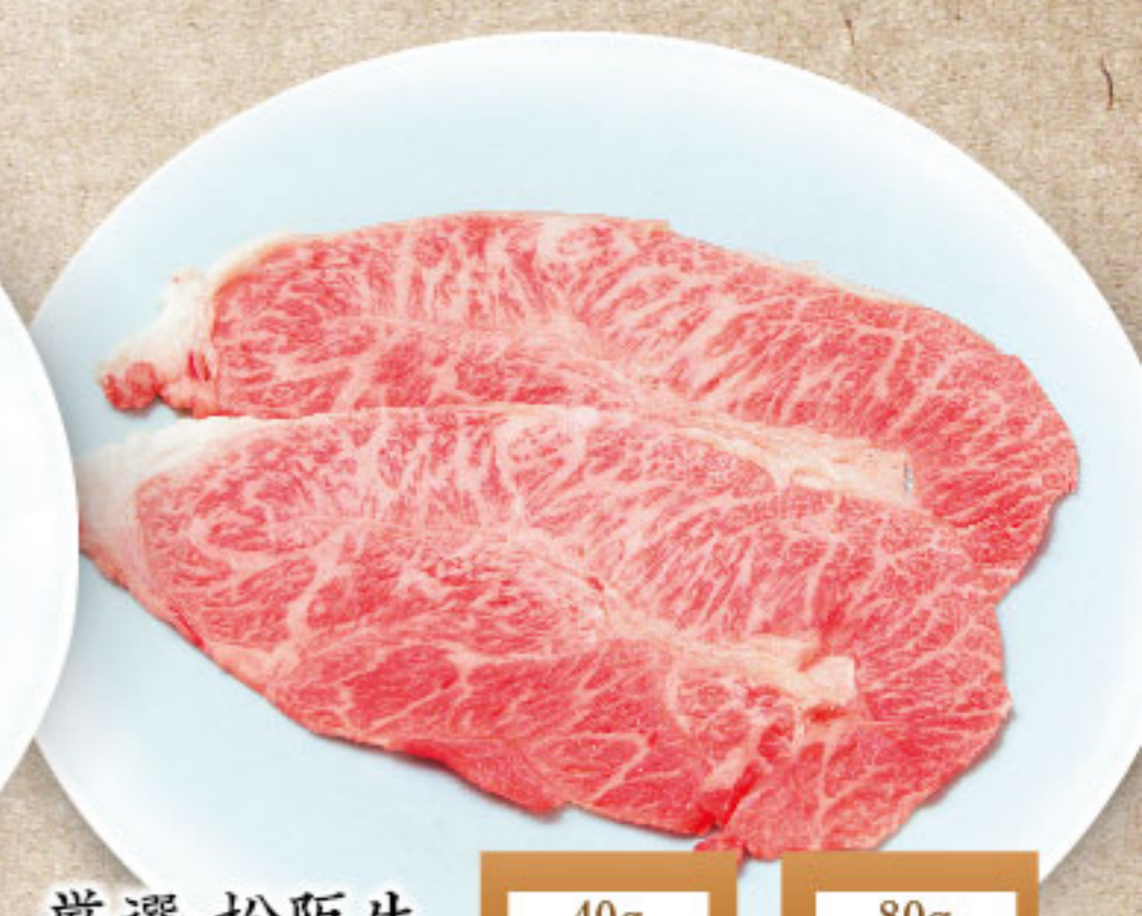
厳選 松阪牛 Specialty Matsusaka Beef 精選松板牛