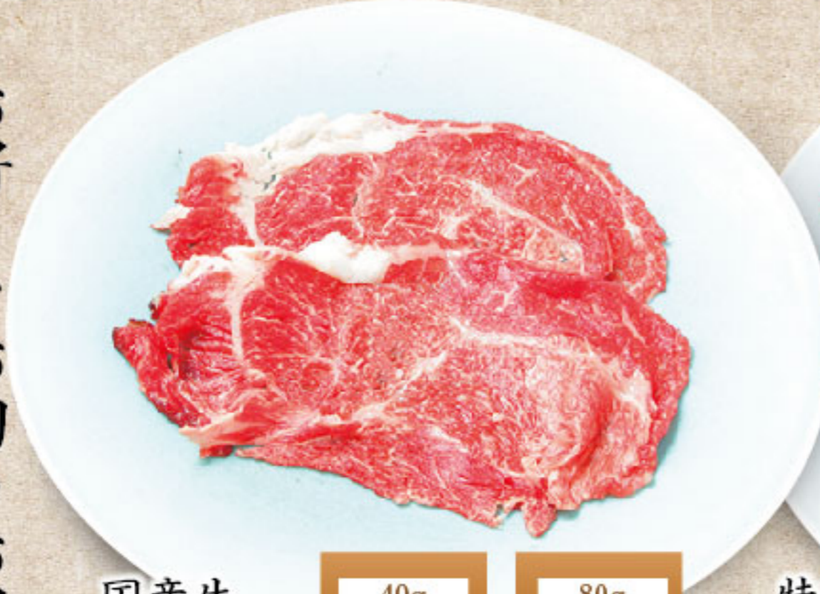
国産牛 Domestic Beef 国产牛肉