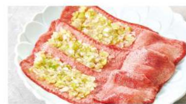
ネギタンしゃぶ Tongue and Leek Shabu-shabu Style