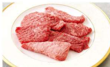
カルビ ■塩 or タレ Short Rib ¥1,580 (税込¥1,738)