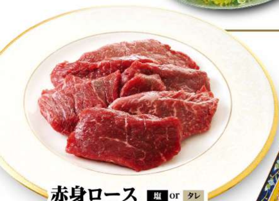
赤身ロース ■塩 or タレ Red Meat Loin ¥1,580 (税込¥1,738)