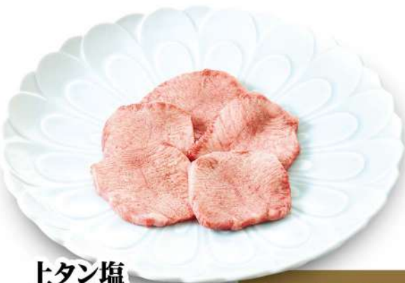
上タン塩 Best of Tongue ¥3,380 (税込¥3,718)