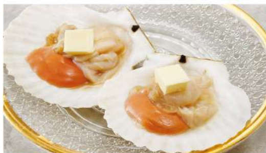
ホタテ焼き Grilled Scallops