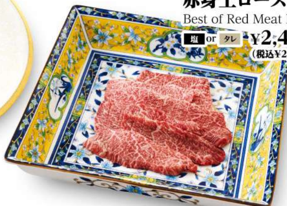
赤身上ロース Best of Red Meat Loin ■塩 or タレ ¥2,480 (税込¥2,728)