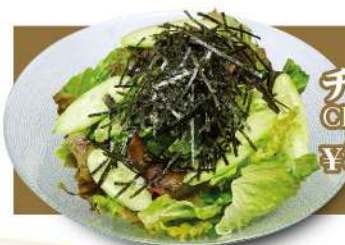
チヨレギサラダ Choregi Salad ¥880 (税込¥968)