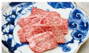
上カルビ ■塩 or タレ Best of Short Rib ¥2,280 (税込¥2,508)