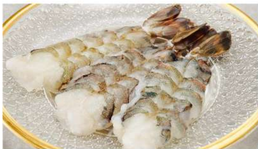
海老焼き Grilled Shrimp