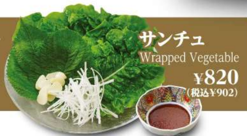
サンチュ Wrapped Vegetable ¥820 (税込¥902)