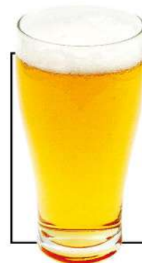
生ビール 中 780円 Medium (税込858円) 小 480円 Small (税込528円)