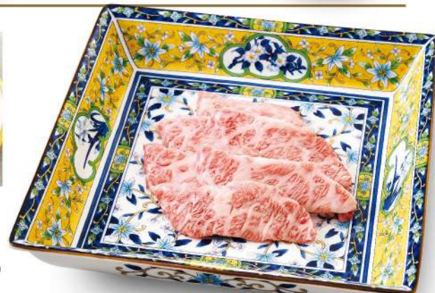
特上カルビ Highest Short Rib ■塩 or タレ ¥2,780 (税込¥3,058)