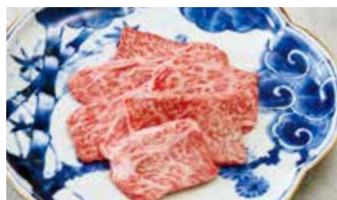
上カルビ ■塩 or タレ Best of Short Rib ¥2,280 (税込¥2,508)