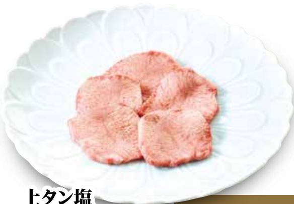
上タン塩 Best of Tongue ¥3,380 (税込¥3,718)