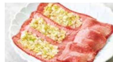
ネギタンしゃぶ Tongue and Leek Shabu-shabu Style