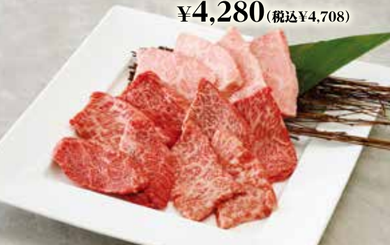
人気の3種盛り合わせ