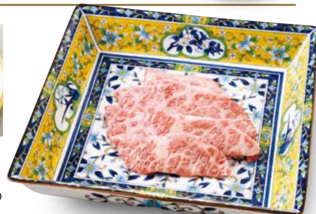
特上カルビ Highest Short Rib ■塩 or タレ ¥2,780 (税込¥3,058)