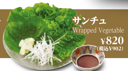
サンチュ Wrapped Vegetable ¥820 (税込¥902)