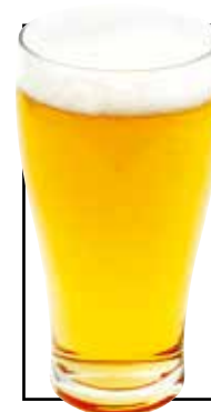
サントリー ザ・プレミアム ・モルツ 〈香る〉エール 780円 (税込858円) 小グラス 480円 Small (税込528円)