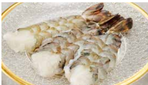
海老焼き Grilled Shrimp