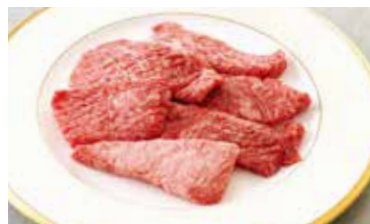
カルビ ■塩 or タレ Short Rib ¥1,580 (税込¥1,738)