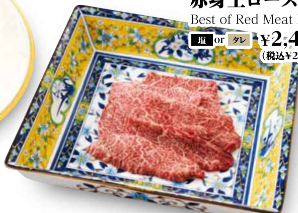
赤身上ロース Best of Red Meat Loin ■塩 or タレ ¥2,480 (税込¥2,728)