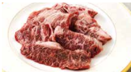
ハラミ Skirt Steak