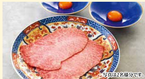
サーロインすき焼き Sirloin Sukiyaki