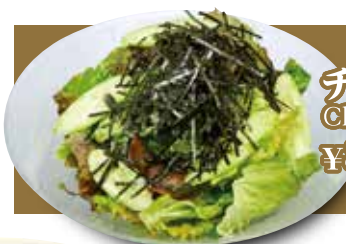
チヨレギサラダ Choregi Salad ¥880 (税込¥968)