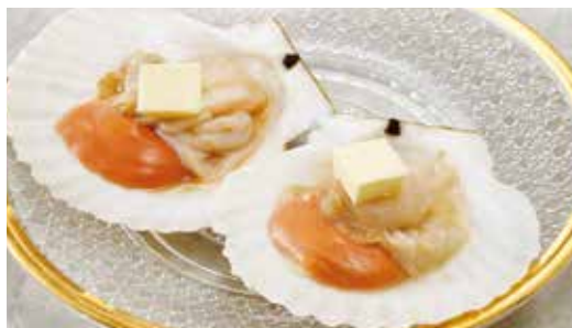
ホタテ焼き Grilled Scallops