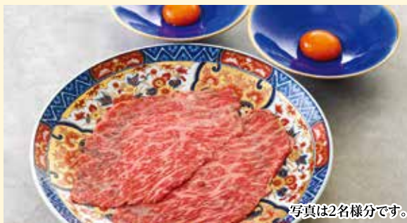
赤身ロースすき焼き Red Meat Loin Sukiyaki