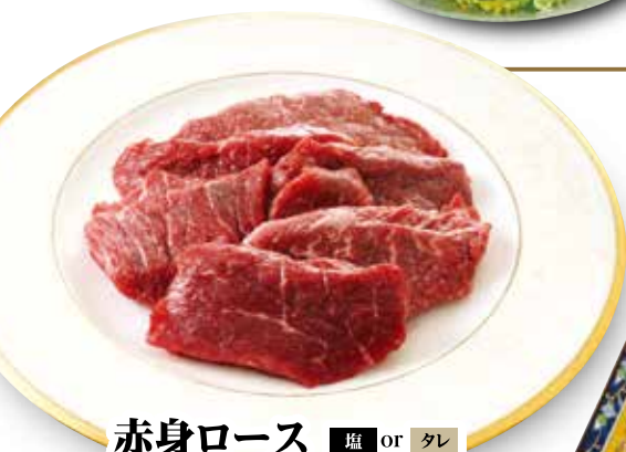
赤身ロース ■塩 or タレ Red Meat Loin ¥1,580 (税込¥1,738)